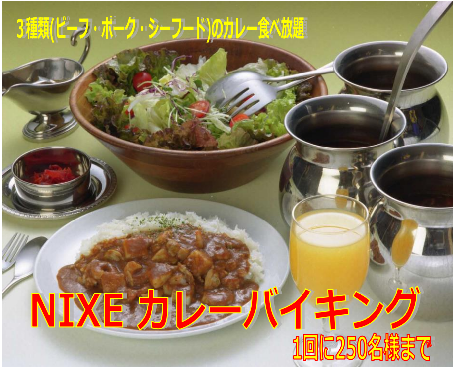
カレーバイキングコロナ対策テーブルイメージ図