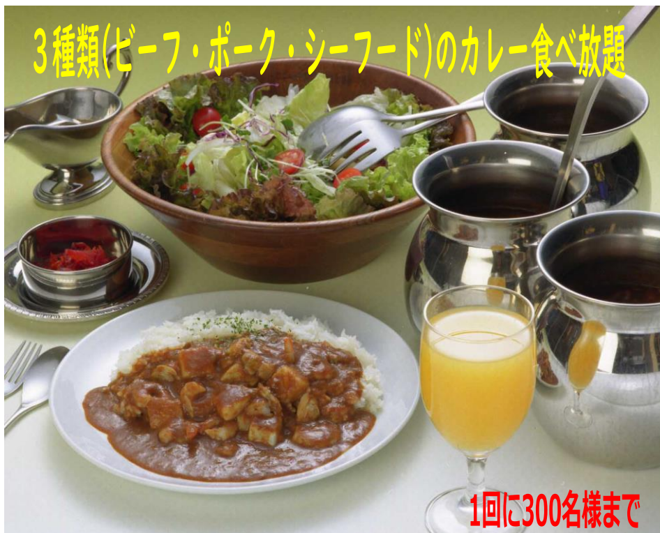
カレーバイキングコロナ対策テーブルイメージ図